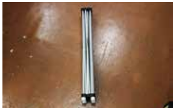
・折りたたみ脚 × 1