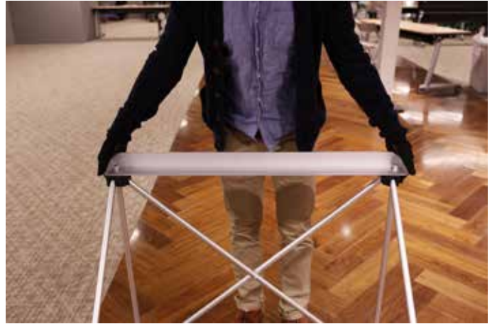
2. 両端に外枠をはめます。