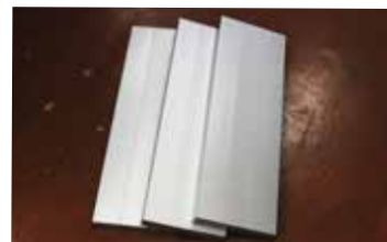
・天板 × 3