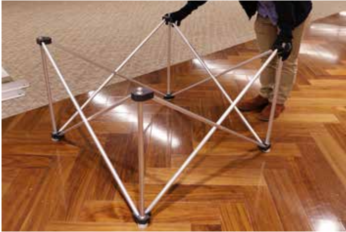
1. 折りたたみ脚を広げます。