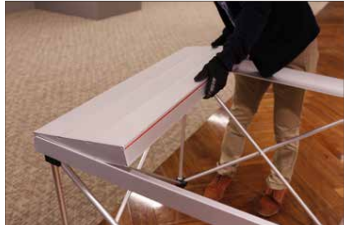
4. 天板を外側から設置。