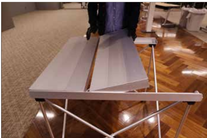
5. オスメス、対になるように設置。