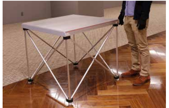
6. 完成。バラシは組み立てと逆手順。