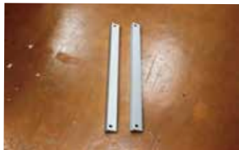
・外枠 × 2